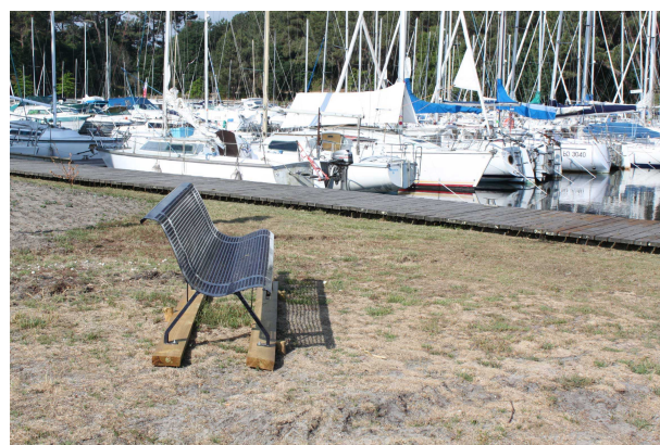
Banc devant la mise à l'eau