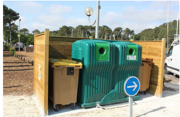
Nouvelles poubelles aux abords des parkings