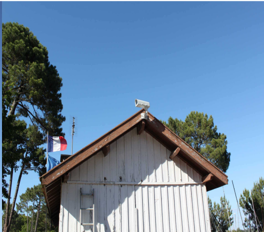
Caméra 1 (capitainerie)