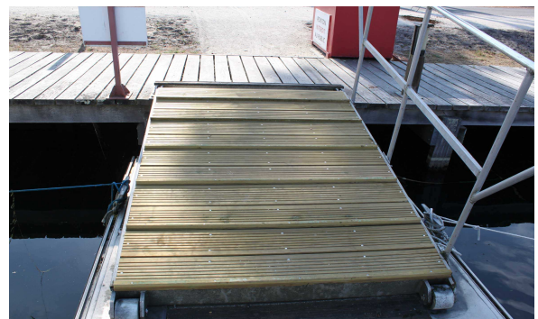
Remise en état des descentes passerelles