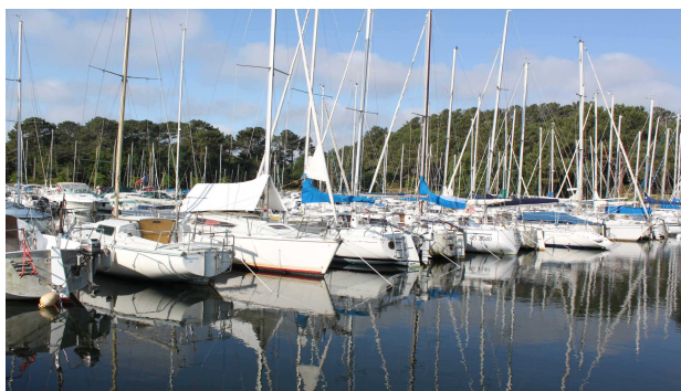
Remise en état des chaînes mère - Traque E