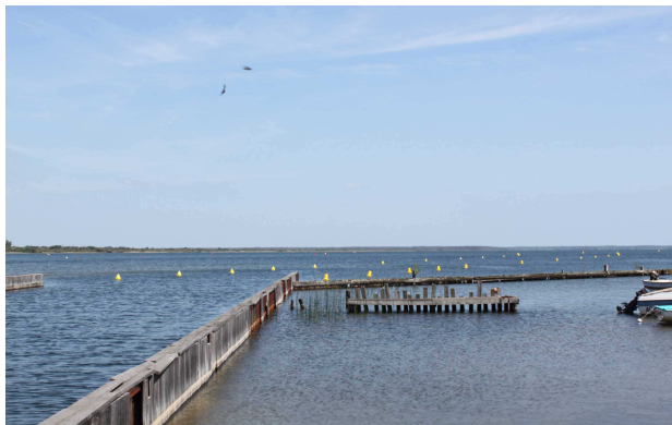
Remise en état des bouées du chenal -