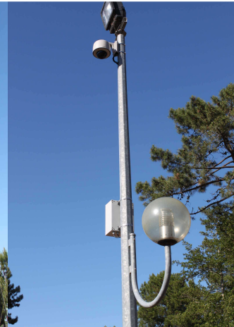
Caméra 2 traque C