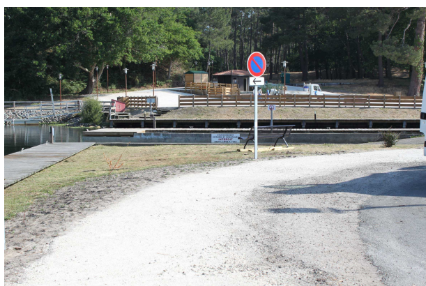
Aire de déchargement de la mise à l'eau