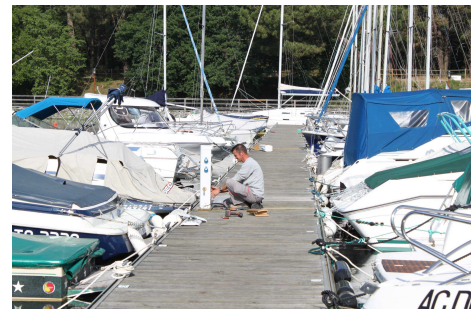
Nouvelles bordes électriques sur les pontons (attention nvelle prise de branchement élect. et eau à se procurer)

*Printemps 2011*