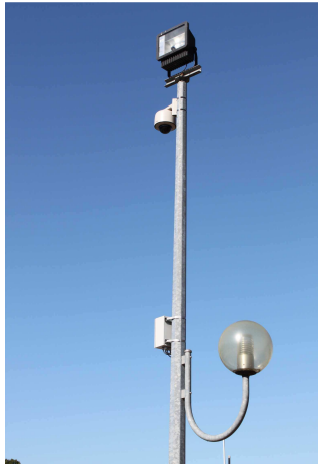
Caméra 3 traque E & F